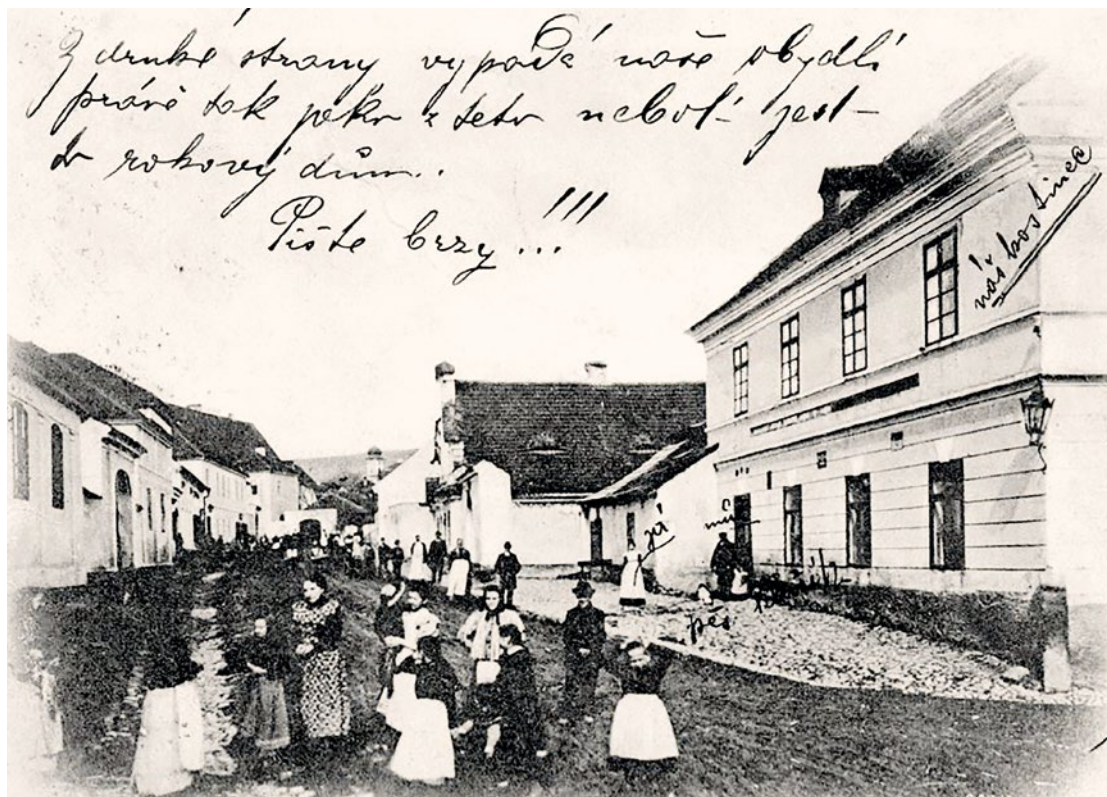
» Hostinec „U české koruny“ (vpravo) – dnes na jeho místě stojí Pasáž Pražská