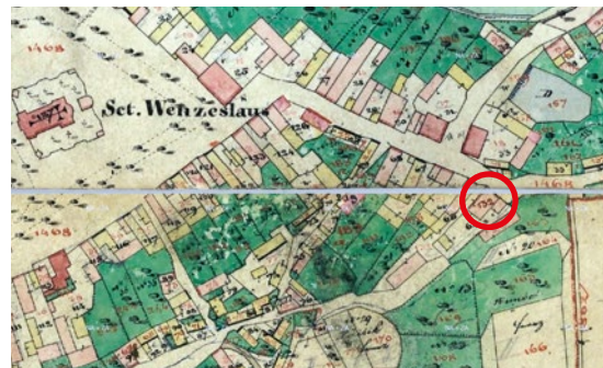
Indikační skica stabilního katastru z roku 1840. Dům č. p. 132 zakroužkovaný

To potvrzuje i „Soudní odhad Mníšeckého panství z roku 1798“, ve kterém se mj. zmiňuje „ dům panského žida páleníka a flusovníka “ 2) z č. p. 132, jehož hodnota byla stanovena na 370 zlatých. Dále se v soudním odhadu uvádí, že „ Žid platil z vinopalny a flusovny 290 zl. za rok “ 3) . Ze zápisu tedy vyplývá, že v domě patřícím mníšecké vrchnosti, hrabatům z Unvertu, bydlel Žid, žijící se pálením kořalky 4) a výrobou flusu 5) , za což platil roční nájemné ve výši 290 zlatých.