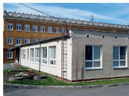
Vchod do areálu ke školní jídelně je z ulice Komenského.