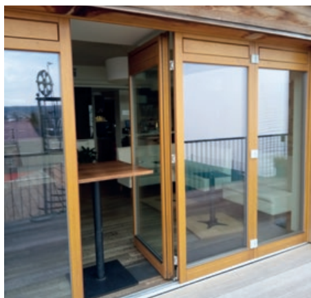
Výdejní okénko Restaurace Lískovka

Jídelní lístek najdete na: www.liskovka.cz Prodej jídla přes okénko: denně 11:00-19:30 Rozvoz jídel: denně 11:00-15:00, minimální odběr 500 Kč Objednávat lze na čísle: 725 155 995