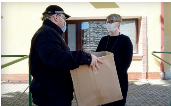
Téměř tisíc respirátorů a jednorázových roušek darovaných spolkem Solární asociace dostali mníšecí senioři.