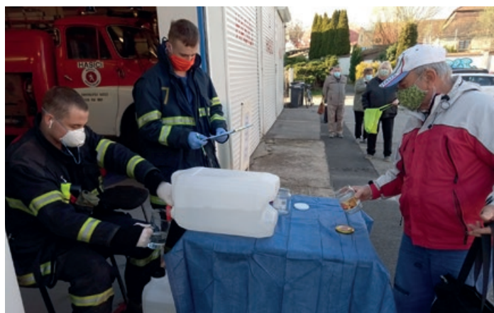
Dezinfekci vydávají mníšecí hasiči denně před svou zbrojnicí.