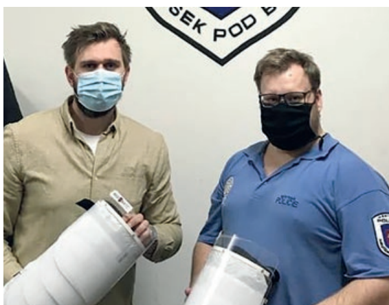
Deset ochranných obličejových štítů získali naši městští strážníci darem od Nadačního fondu REGI Base I.