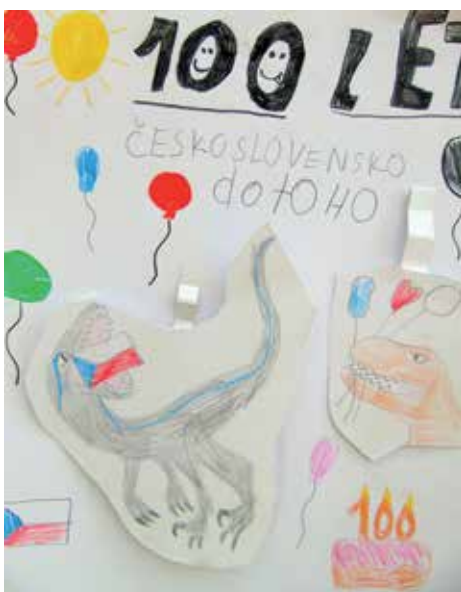
Cena za kreativitu Dominika a Michaela pátá třída

Tentokrát bylo téma zaměřené na 100 let České republiky. Sešla se nám opět úžasných prací, a protože rozhodování je vždy velmi těžké, pomohli nám žáci sedmých tříd s paní učitelkou Lenkou Krupkovou, kteří rozhodli o prvním až třetím místě, a my jsme udělili zvláštní cenu za kreativitu 3D projektu děvčat z páté třídy. Všechny výtvarné a literární práce si můžete prohlédnout na schodech do dětského oddělení městské knihovny.