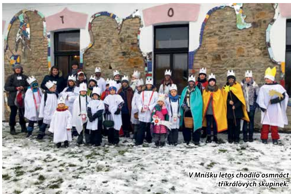
V Mníšku letos chodilo osmnáct tříkrálových skupinek.

Cílem sbírky je finanční pomoc sociálním projektům u nás i v zahraničí. Letos je to podpora těchto projektů: poradna Magdala, která se věnuje obětem násilí, materiální pomoc nej-