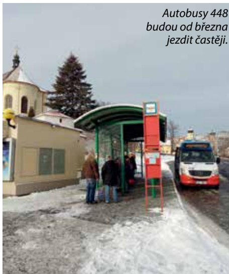
Autobusy 448 budou od března jezdit častěji.

„Někteří občané jezdí například do Dobřichovic za nákupy nebo i k lékaři, proto posílení spojů tak, aby se rozumně dostali tam i zpět, pro vedení města dává smysl,“ uvedla starostka Magdaléna Davis, která se zúčastnila jed-