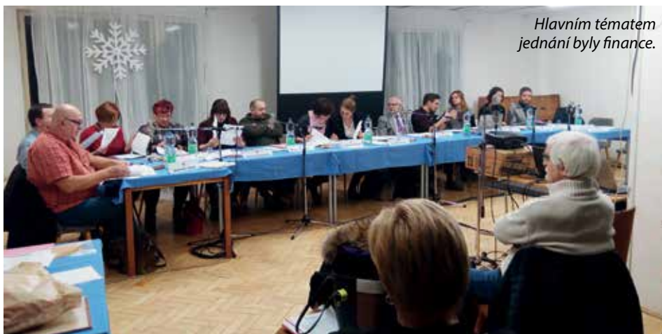
Hlavním tématem jednání byly finance.