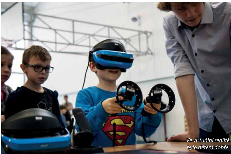
Ve virtuální realitě bylo dětem dobře.

Virtuální realitu, rozšířenou realitu, robotiku, laboratorní pokusy z fyziky, vesmírného programu s výukovou hrou startu rakety v mezinárodním projektu Space Camp, 3D tisk, projekty ke stavbě rakety, hrací hnízdo, multimediální pracoviště Mediálního domu Preslova, či droní arény. To vše mohli spatřit na deseti stanovištích návštěvníci prosincového festivalu, který v Základní škole Komenského 420 navštívilo přes osm set dětí ve věku od pěti do patnácti let. Na své si přišli i rodiče žáků.