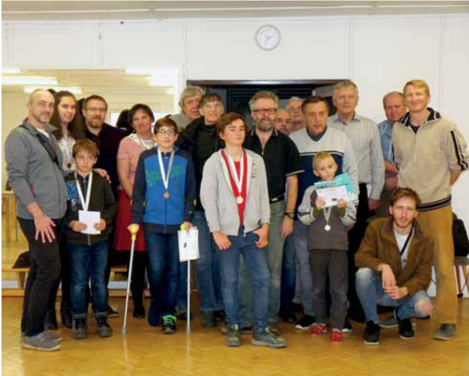
Sešla se dvacítka šachistů a šachistek.

N edlouho před koncem roku 2018 se v Městském kulturním středisku v Lipkách uskutečnil další ročník šachového turnaje Mníšecká rošáda. Tentokrát i za účasti žen.