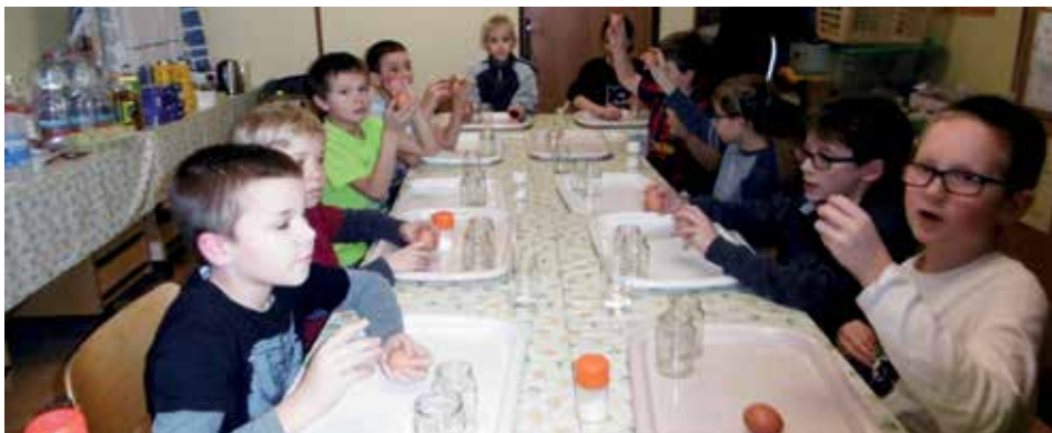
Děti diskutují nad tím, jak poznají uvařené vajíčko od syrového, aniž by ho poškodily.

Spousta povídání i zábavných pokusů čekala děti z Brdského šikuly na jejich uplynulých setkáních. Dozvěděly se, jak funguje uzavřený a otevřený elektrický obvod, co jsou vodiče a izolanty, povídali jsme si také o kationech a anionech. Ukázali jsme si, jak se dá elektrický proud a elektrolyza využít k malování.