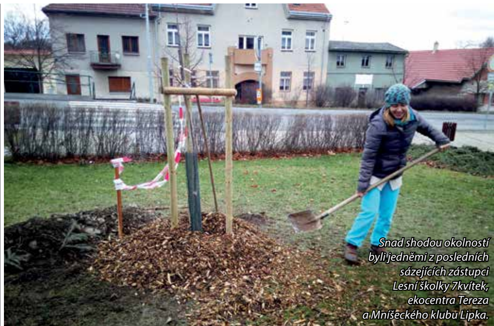
Snad shodou okolností byli jedněmi z posledních sázejících zástupci Lesní školky 7kvítek, ekocentra Tereza a Mníšeckého klubu Lipka.