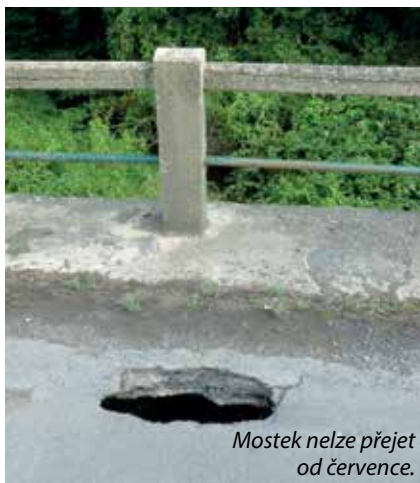
Mostek nelze přejet od července.