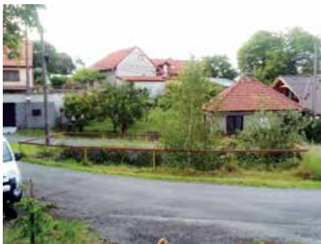
Požární nádrž dřívě.

Letos bude třeba započaté dílo úplně dokončit. U silnice chybí zábradlí, které v nejbližší době město nechá osadit tak, aby průchod a průjezd kolem nádrže byl bezpečnější. Dále je ještě nutné zasít trávu a finalizovat parkovou úpravu. Pokusíme se oslovit studenty a studentky zahradní architektury, aby nám pomohli s vhodnou výsadbou rostlin pro zkrášlení okolí nádrže. Dokončenou stavbu musíme ještě bedlivě pozorovat a mít jistotu, že vše dobře funguje i v případě větších srážek.