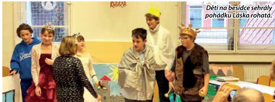
Děti na besídce sehrály pohádku Láska rohatá.

Za velké účasti rodičů a přátel školy se 18. prosince uskutečnila tradiční vánoční besídka. V novém roce nás čeká mnoho zajímavého.