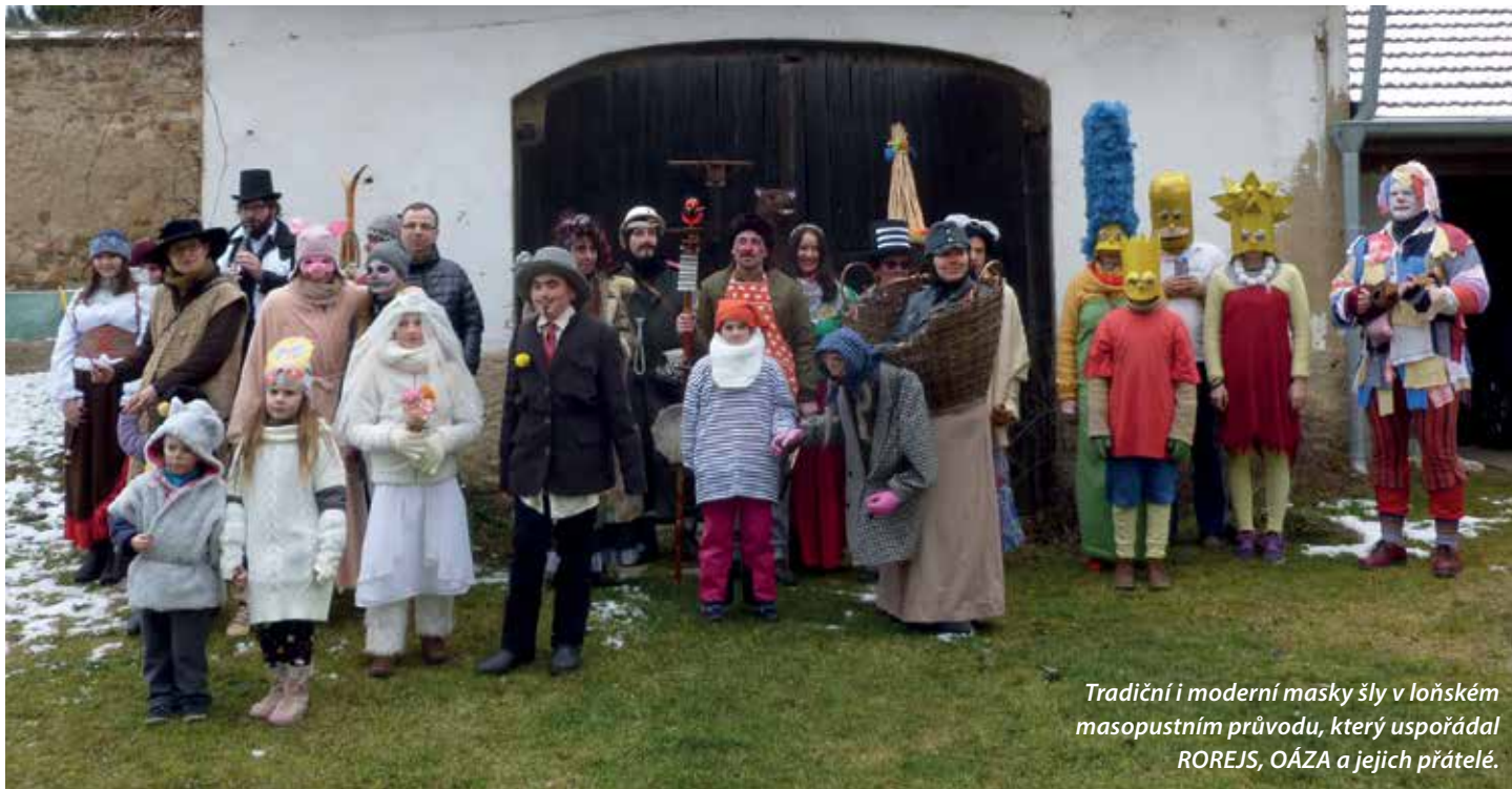
Tradiční i moderní masky šly v loňském masopustním průvodu, který uspořádal ROREJS, OÁZA a jejich přátelé.