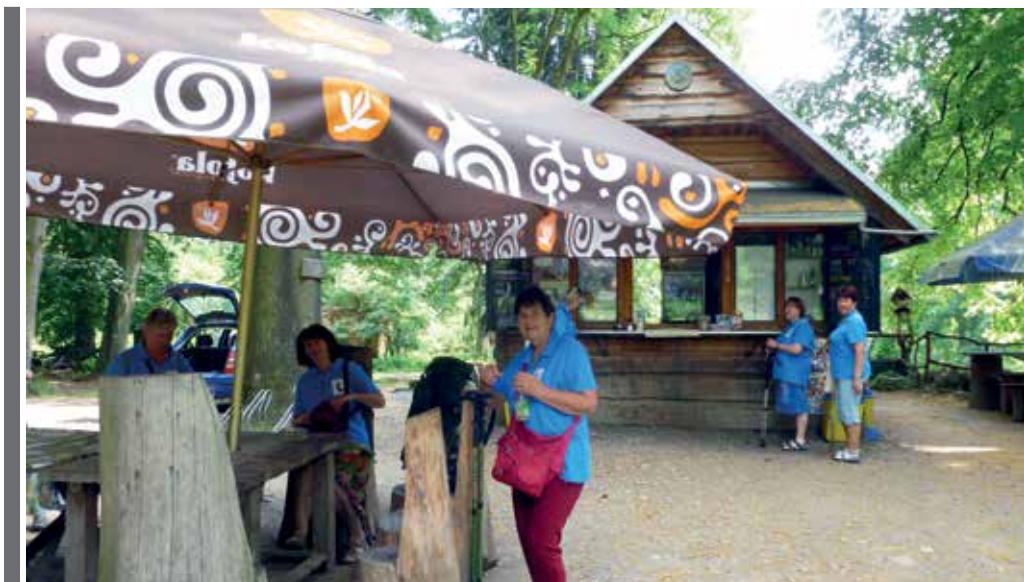
Ilustrační foto z archivu redakce.

Konec starého a začátek nového roku je časem ohlédnutí i očekávání. A jinak tomu není ani v mníšeckém Klubu důchodců, kde se senioři a seniorky setkávají v Městském kulturním středisku dvakrát týdně.