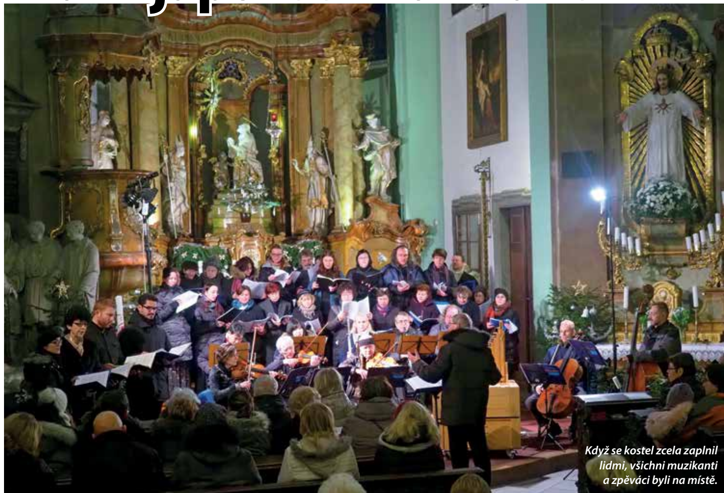
Když se kostel zcela zaplnil lidmi, všichni muzikanti a zpěváci byli na místě.