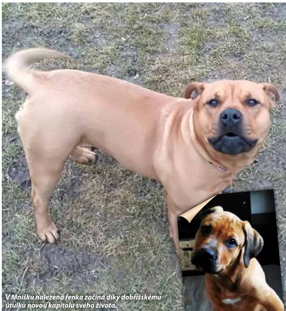
V Mníšku nalezená fenka začíná díky dobříšskému útulku novou kapitolu svého života.