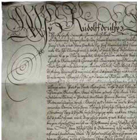
Faksimile listiny Rudolfa II z roku 1601.