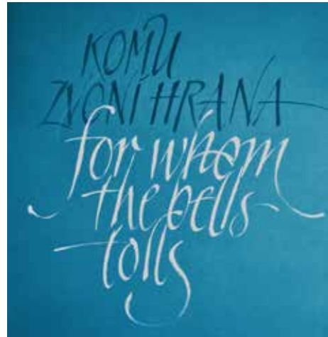
Použití renesanční kaligrafie na obálce knihy.

Renesanční kurzíva je dodnes nejčastěji používané kaligrafické písmo. Zhruba polovina všech kalografií vychází z renesanční kurzívy, která přesně odrážela renesanční ideály. Písmo bylo na pohled krásné, živé, umožňovalo spoustu různých protažení, ozdob, bylo dynamické a velmi dobře čitelné. Jednotlivá písmena se dala napsat jedním tahem. Oproti tomu třeba písmo období vrcholné gotiky se obtížně psalo i četlo. Gotické knihy vznikaly v klášterních písařských dílnách, kde byl dostatek času a klidné prostředí.