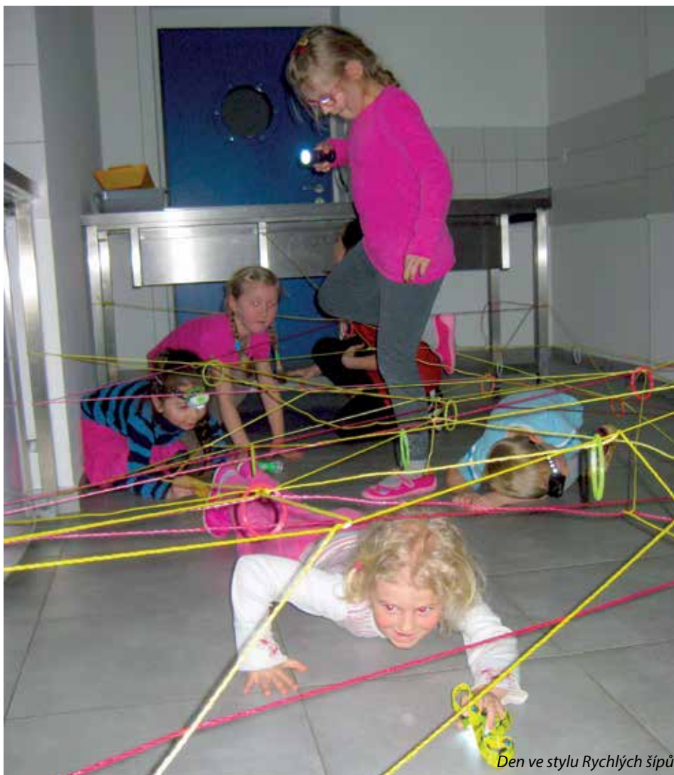
Den ve stylu Rychlých šípů

Ráno čekala na děti bohatá snídaně, připravená z dobrot z „domácích zdrojů“. Přišli si