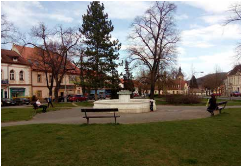
Popisek: Studie nového řešení náměstí Krále Jiřího z Poděbrad by měla být hotová letos na podzim.