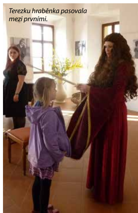
Terezku hraběnka pasovala mezi prvňáky.