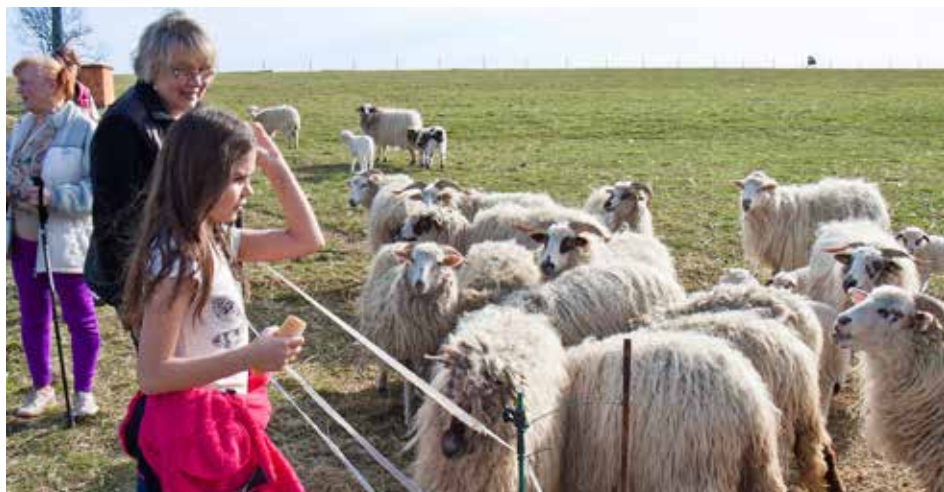
Farma Klínek připomíná malou ZOO. Pořádá se tady i řada kulturních akcí.

Rozšíříme chov krav o masné plemeno, abychom měli vlastní hovězí maso, a přibude kůň s poníkem. O další druhy zvířat už farmu rozšiřovat nebudeme, to spíše naopak. Kráček ve dvoře bude nyní ještě plnější, budeme v něm nabízet vlastní mléčné výrobky. Ale nechceme tady mít žádnou velkovýrobu. Chceme, aby to byla ruční práce, aby v tom výrobku byla duše. Nestojíme o to, vydělávat miliony. Stačí nám, když nás to uživí, a bude nás to bavit.