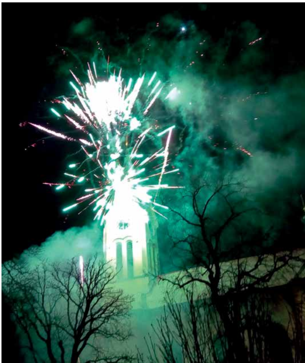
Tradiční ohňostroj při Předčasném Silvestru nevdá ani zastáncům větší regulace.

Obce skutečně mají nástroj na to, aby nadužívání těchto hlukových a světelných efektů zarazily. Můžou schválit obecně závaznou vyhlášku, která přináší na jedné straně řád, na druhé straně ale znamená regulaci. Zákaz pak neplatí paušálně na celém jejich území, ale