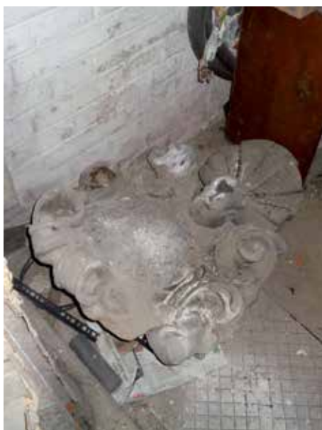
Místo nálezu sochy ve sklepě bytového domu v Praze 3 na Vinohradech