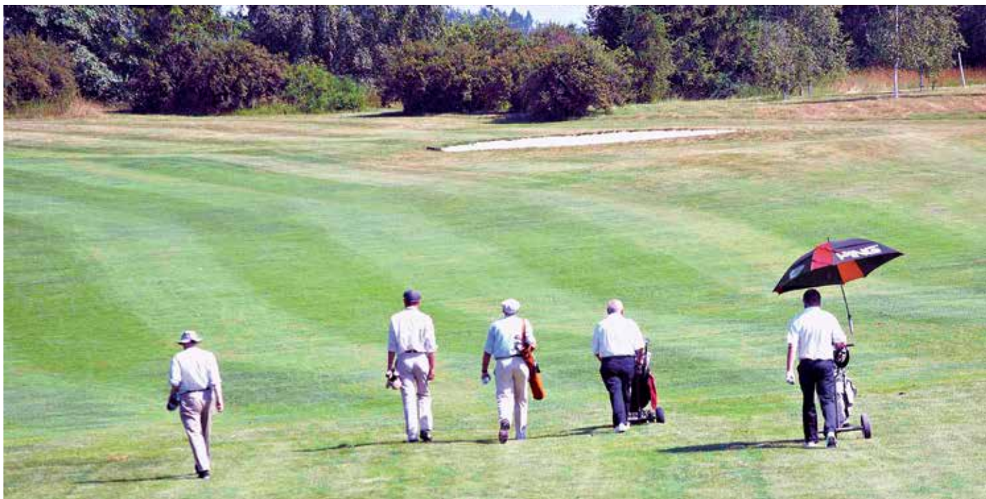
Golf je jedinečnou kombinací sportu, zábavy a nenáročného pohybu v přírodě...