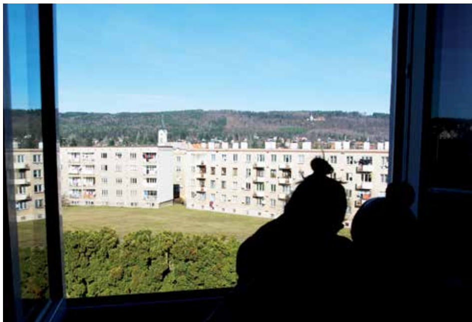
Z okna byl strategický přehled o řešeném prostoru...

Ačkoliv se jednotlivé návrhy lišily v jednotlivostech, v podstatě se všichni shodli, že by školu a Pavilon měla obklopit aktivní herna