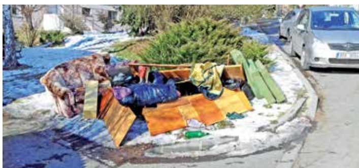
Černá skládka na Skaleckém náměstí

Jaroslav Vyskočil, vedoucí technického úseku, odbor správy majetku a investic