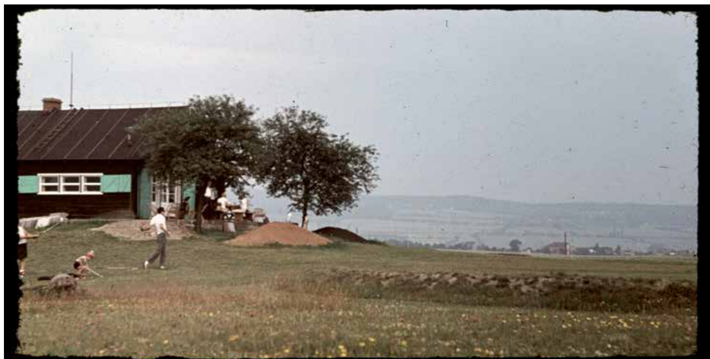
Historické foto klubovny z jara roku 1969