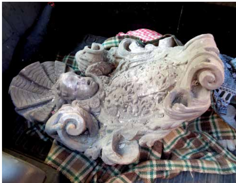
Socha je naložena a po letech se vrací zpět, domů...