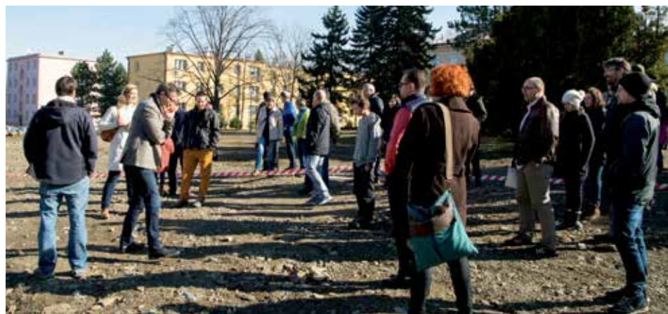
Jedním z největších témat v terénu byl uvažovaný zemní val, v návrzích se mu věnovali všichni.

pod širým nebem, a že by bylo vhodné zemní val buď zúžit nebo nějak kreativně využít. Vznikla tu řada nápadů, jak val začlenit do parku - například formou přírodních lavic, či malých pódíí nebo mostkem vytvářejícím vstupní bránu do prostoru před školou a Pavilonem. Návrhy ze všech pracovních skupin se stanou podkladem a inspirací pro práci architektů. Příjemným překvapením byli školáci, kteří si do návrhů prosadili prostor pro aktivní pohyb.